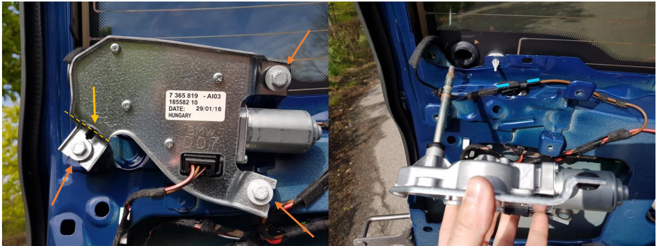
Abbildung 5 - Wischer Mechanik demontieren

Man zieht den Stecker ab und schneidet noch den einen Kabelhalter (gelb markiert) von der Heckscheibenheizung ab. Danach löst man die 3 Schrauben (ebenfalls 10er Nuss), und schon hält man die Mechanik in Händen.