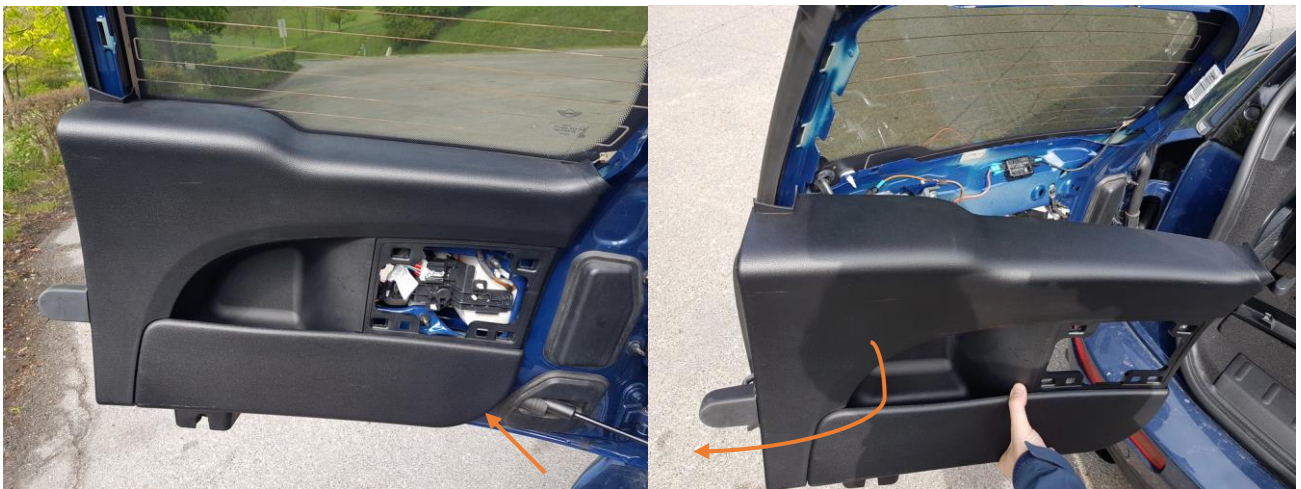
Abbildung 4 - untere Verkleidung entfernen

Bei der unteren Verkleidung nimmt man die Abdeckung für die Lampen ab und setzt an der unteren Ecke, wo die Gasdruckfeder die Türe aufdrückt, mit einem Keil an um die Verkleidung auszuhebeln. Es gibt keine Schrauben, aber ein paar Klips. Wenn man nicht brutal anreißt, kann man auch hier nichts falsch machen.