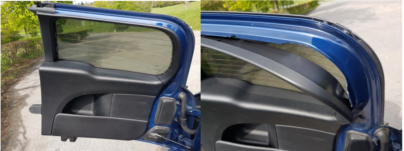
Abbildung 3 - obere Verkleidung entfernen

Als erstes nimmt man den oberen Teil der Verkleidung ab. Dazu zieht man einfach mit einem ordentlichen Ruck an der oberen Ecke, wie im Bild gezeigt. Die Verkleidung ist nur gesteckt und man kann eigentlich nichts ruinieren dabei.