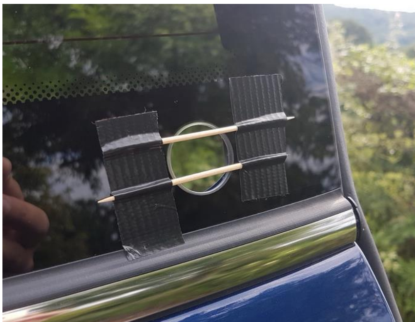
Abbildung 7 - Zahnstocher

So schließt der Glasstoppel auf jeden Fall auf selber Höhe wie die Heckscheibe ab 😊