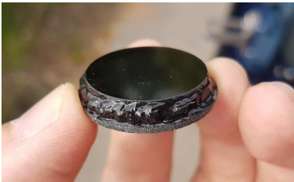
Abbildung 8 - Stoppel mit Kleber

Als nächstes wird auch der Glasstoppel mit dem Spezialreiniger geputzt, und dann kann man auch schon damit beginnen den Kleber aufzutragen.