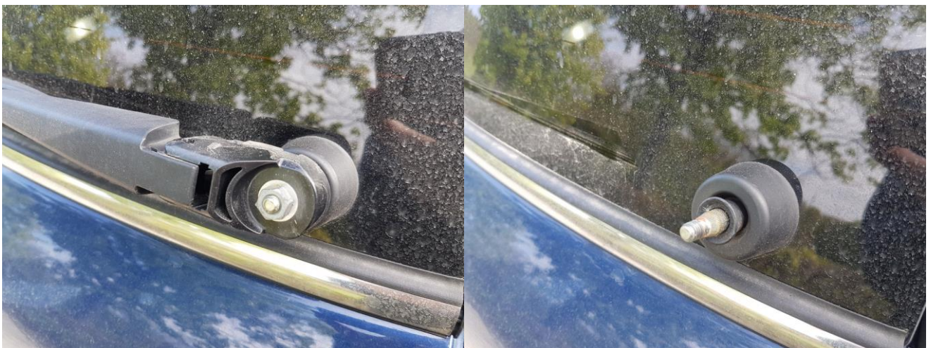
Abbildung 2 - Kappe abnehmen, Mutter lösen und Arm abnehmen

Darunter befindet sich eine 10er Mutter, welche man öffnet, und schon kann man ohne viel Aufwand den Wischerarm herunternehmen. Je nach Alter kann dieser auch durch Schmutz etwas fester sitzen.