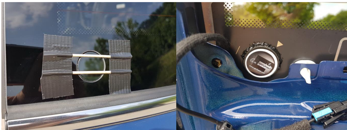
Abbildung 9 - eingesetzter Glasstoppel

Jetzt setzt man den Stoppel dann vorsichtig von innen ein und wischt außen eventuell überquellenden Kleber ab.