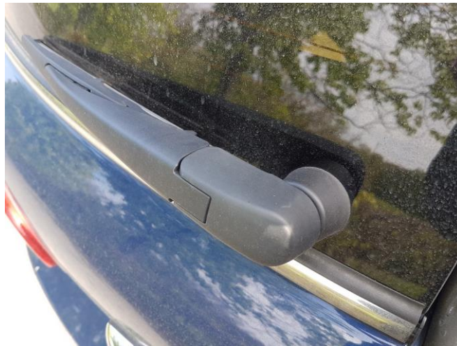
Abbildung 1 - Wischerarm

Als erstes beginnt man auf der Außenseite und nimmt die Kappe beim Wischerarm herunter. Diese ist nur aufgeklipst und man benötigt kein Werkzeug dafür.