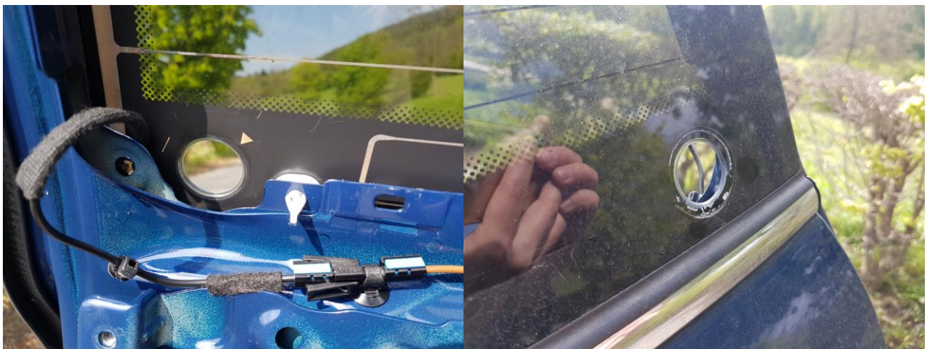
Abbildung 6 - Gummidurchführung entfernen

Jetzt kann man den Gummistoppel aus der Heckscheibe herausholen.